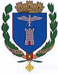
Ville de Breil sur Roya