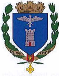
Ville de Breil sur Roya