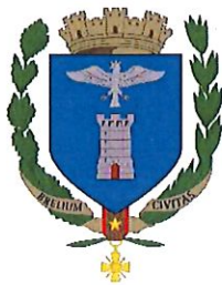
Ville de Breil sur Roya

DEPARTEMENT DES ALPES-MARITIMES ----- ARRONDISSEMENT DE NICE ----- MAIRIE DE BREIL-SUR-ROYA