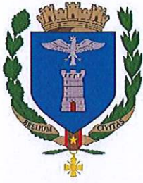
Ville de Breil sur Roya