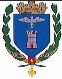
Ville de Breil sur Roya